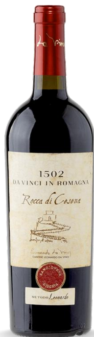
ROCCA DI CESENA