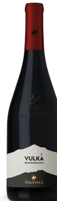
VULKA' ETNA ROSSO