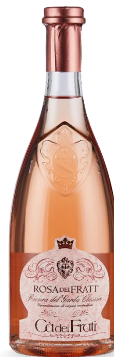
ROSA DEI FRATI