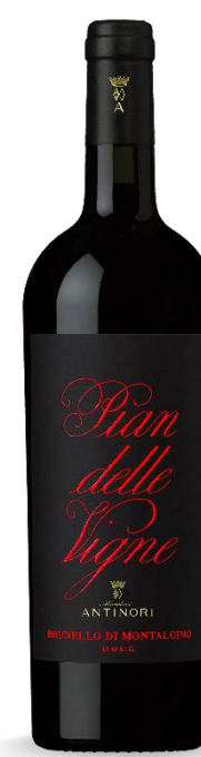
PIAN DELLE VIGNE ANTINORI