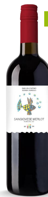
SANGIOVESE MERLOT SAN VALENTINO