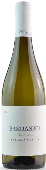
BASTIANICH RIBOLLA GIALLA