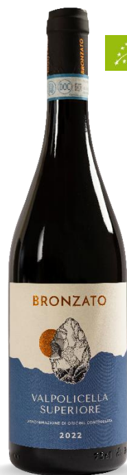
BRONZATO VALPOLICELLA SUPERIORE