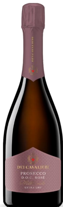
TREVISO EXTRA DRY ROSE'