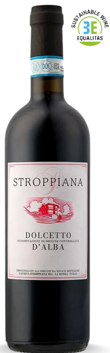
STROPPIANA DOLCETTO D'ALBA