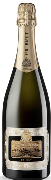
MONTEN ROSSA P.R. BRUT