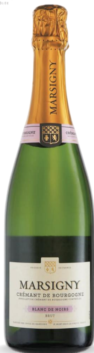
MARSIGNY CREMANT DE BOURGOGNE