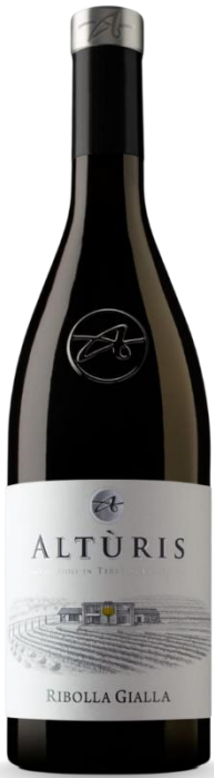
ALTURIS RIBOLLA GIALLA