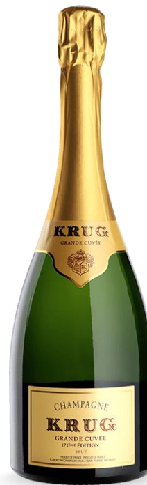
KRUG BRUT GRAN CUVÉE