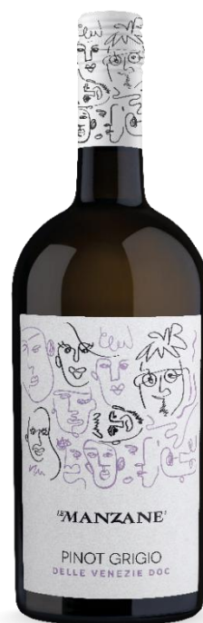
LE MANZANE PINOT GRIGIO