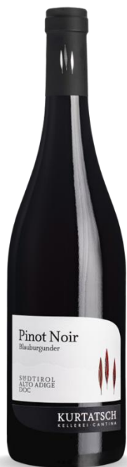
PINOT NOIR KURTATSCH