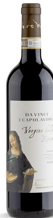
VERGINE DELLE ROCCE RISERVA