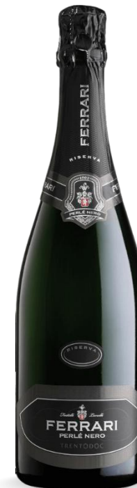
PERLE' NERO EXTRA BRUT RISERVA