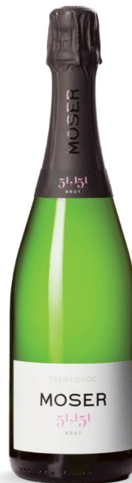
MOSER 51,151 BRUT