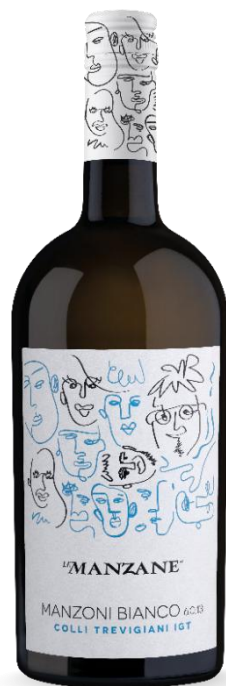
LE MANZANE MANZONI BIANCO