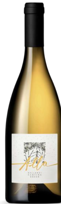
ALLA KELLEREI BOZEN