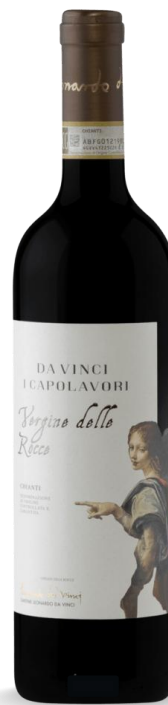
VERGINE DELLE ROCCE