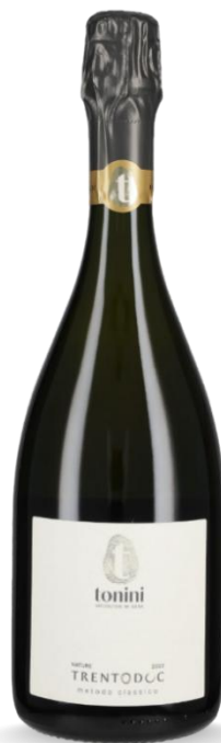
TONINI BRUT NATURE