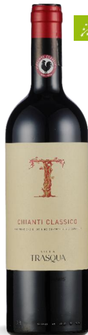
VILLA TRASQUA CHIANTI CLASSICO