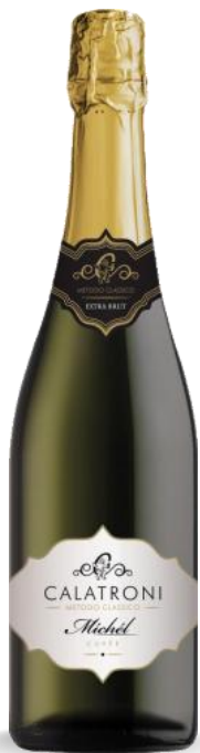
CALATRONI MICHEL EXTRA BRUT