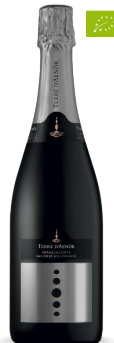
TERRE D'AENOR PAS DOSE'