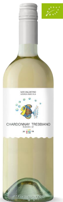
CHARDONNAY TREBBIANO SAN VALENTINO