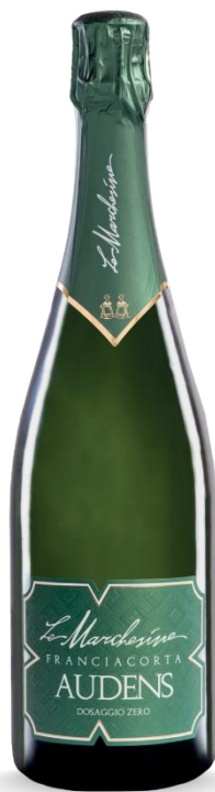
AUDENS DOSAGGIO ZERO