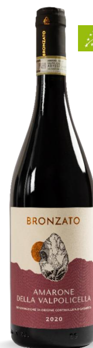
BRONZATO AMARONE VALPOLICELLA