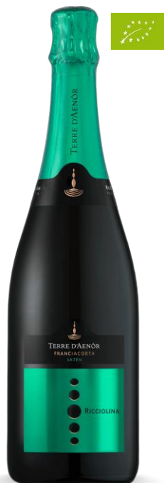
TERRE D'AENOR RICCIOLINA SATÈN