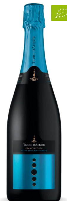
TERRE D'AENOR EXTRA BRUT