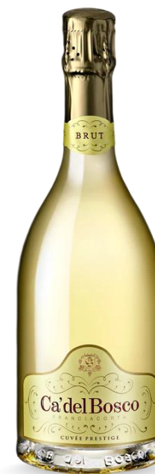
CA' DEL BOSCO PRESTIGE