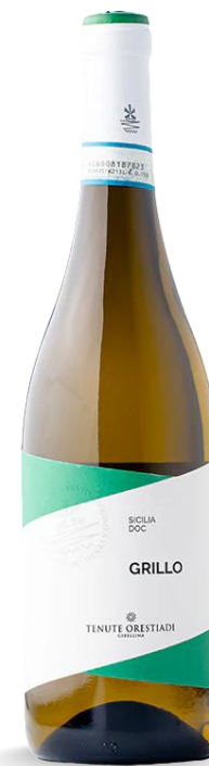
GRILLO TENUTE ORESTIADI