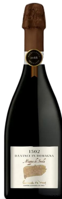
MAPPA DI IMOLA