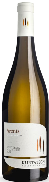
ARENIS KURTATSCH GEWURZTRAMINER