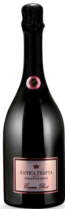
ANTICA FRATTA ESSENCE ROSE'