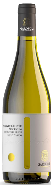
SERRA DEL CONTE