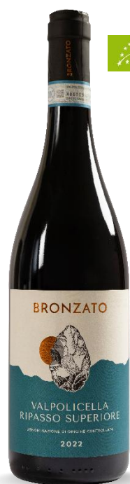
BRONZATO VALPOLICELLA RIPASSO SUPERIORE