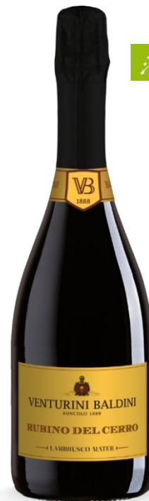
LAMBRUSCO RUBINO DEL CERRO