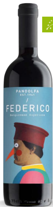
FEDERICO TENUTA PANDOLFA