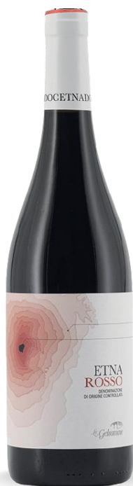
LA GELSOMINA ETNA ROSSO