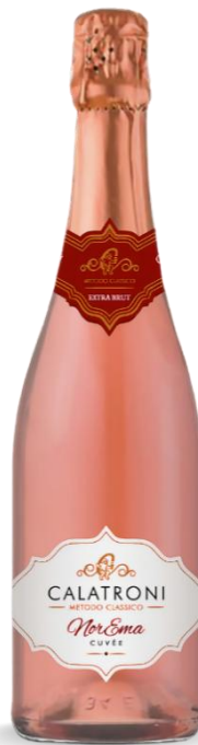
CALATRONI NOREMA ROSE' EXTRA BRUT