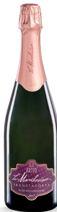
ARTIO ROSE' MILLESIMATO