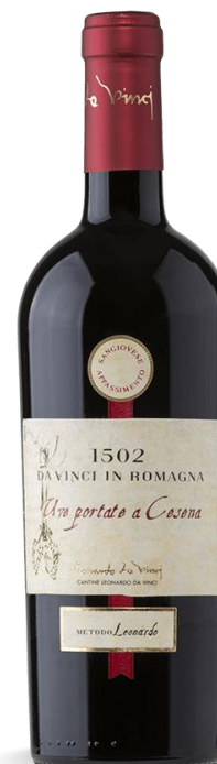
'UVE PORTATE A CESENA' APPASSIMENTO