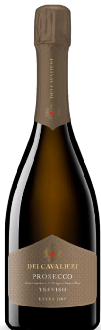
TREVISO EXTRA DRY