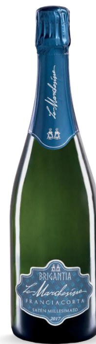
BRIGANTIA SATEN MILLESIMATO