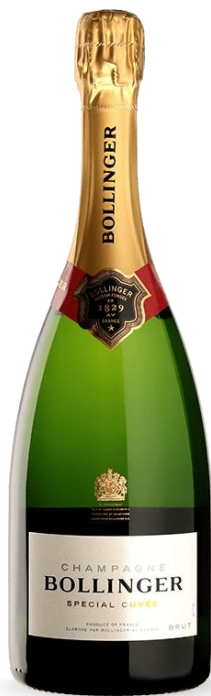
BOLLINGER BRUT SPECIAL CUVÉE