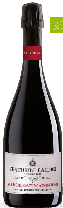
LAMBRUSCO MARCHESI MANODORI