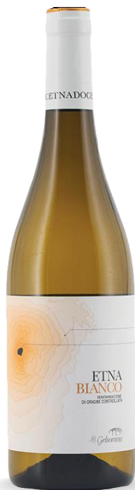
LA GELSOMINA ETNA BIANCO