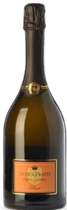
ANTICA FRATTA BRUT