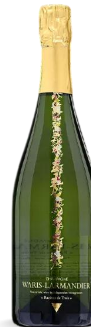
WARIS-LARMANDIER EXTRA BRUT