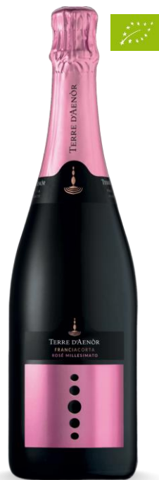
TERRE D'AENOR ROSE'