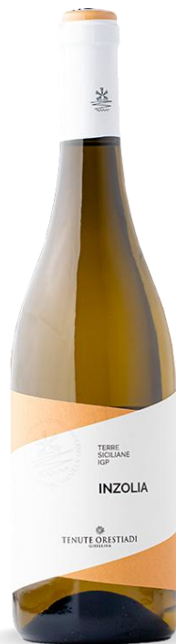
INZOLIA TENUTE ORESTIADI