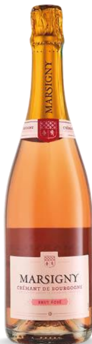
MARSIGNY ROSE' CREMANT DE BOURGOGNE