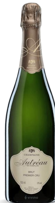
AUTREAU PREMIER CRU