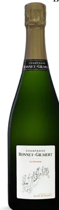
BONNET-GILMERT BRUT RESERVE GRAND CRU