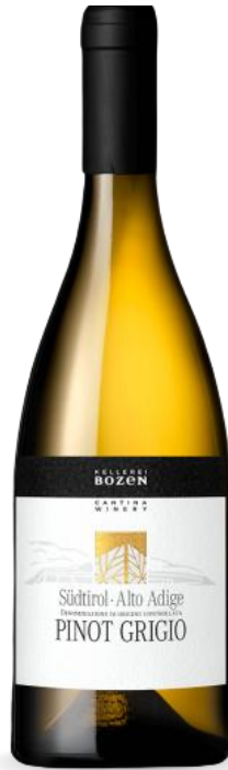
PINOT GRIGIO KELLEREI BOZEN