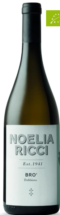
BRO' NOELIA RICCI