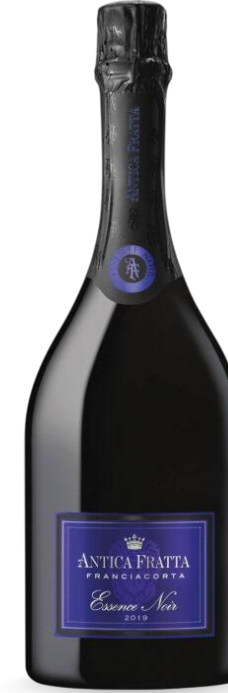
ANTICA FRATTA ESSENCE NOIR