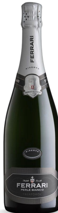
PERLE' BIANCO BRUT RISERVA