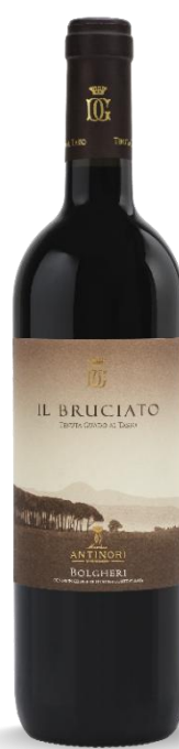
IL BRUCIATO BOLGHERI