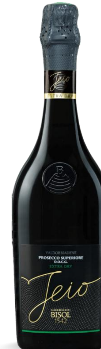
JEIO EXTRA DRY