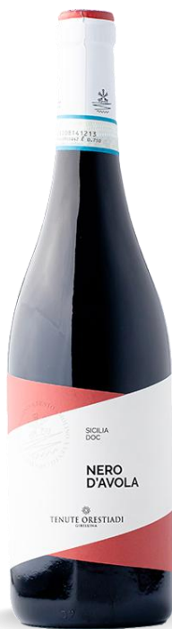
ORESTIADI NERO D'AVOLA