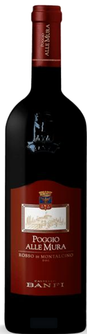
POGGIO ALLE MURA ROSSO DI MONTALCINO