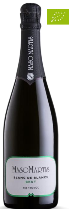
MASO MARTIS BRUT