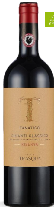
FANATICO VILLA TRASQUA CHIANTI CLASSICO RISERVA