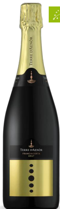
TERRE D'AENOR BRUT