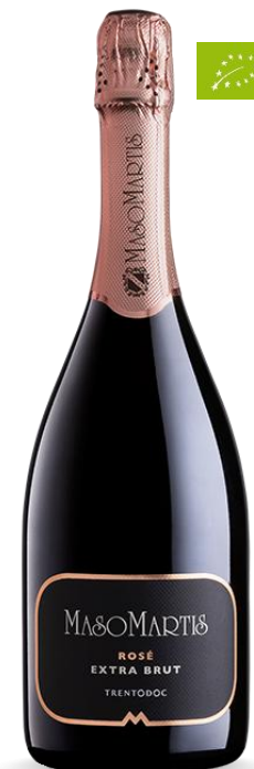
MASO MARTIS ROSE' EXTRA BRUT