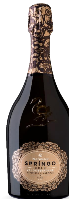
SPRINGO DRY CARTIZZE