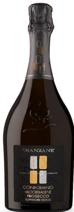
LE MANZANE BRUT