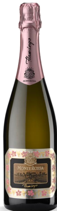
MONTEN ROSSA FLAMINGO ROSE'