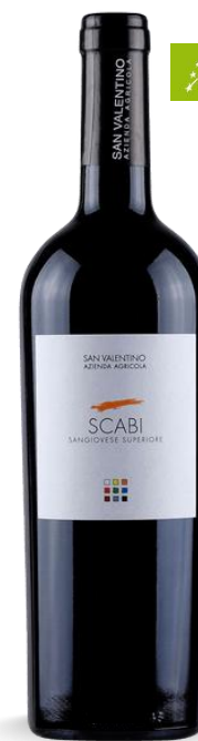
SCABI SAN VALENTINO