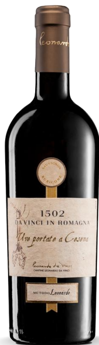
'UVE PORTATE A CESENA' SAUVIGNON