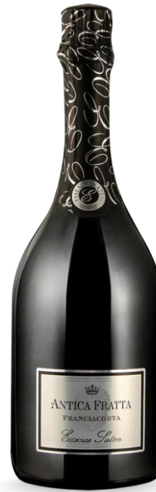
ANTICA FRATTA ESSENCE SATEN