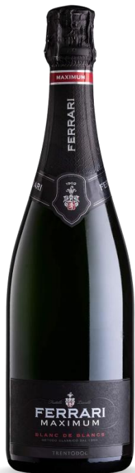
MAXIMUM BRUT BLANC DE BLANCS