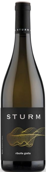
RIBOLLA GIALLA STURM