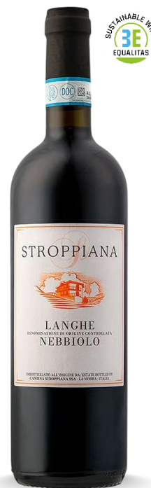
STROPPIANA LANGHE NEBBIOLO