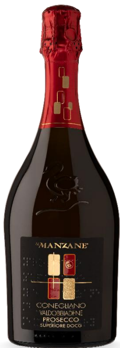
LE MANZANE EXTRA DRY