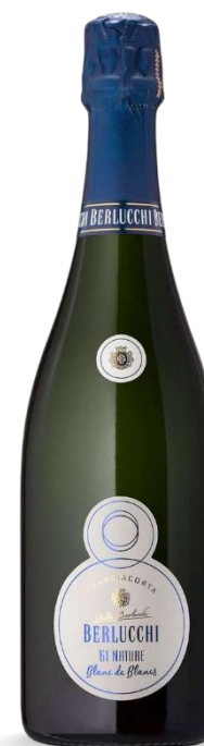
BERLUCCHI 61 DOSAGGIO ZERO BDB