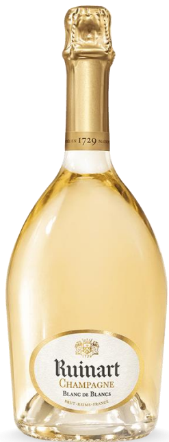
RUINART BRUT BDB