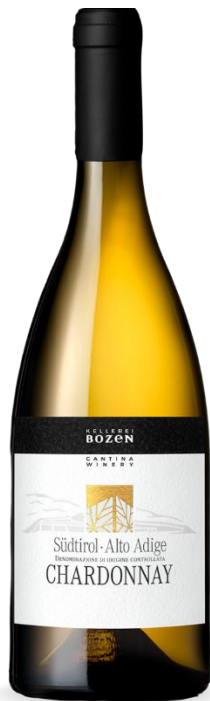
CHARDONNAY KELLEREI BOZEN