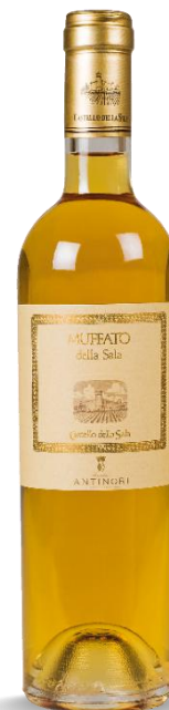
MUFFATO DELLA SALA