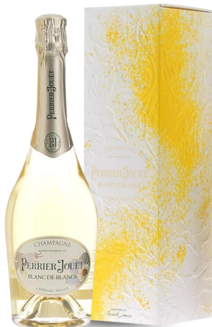
PERRIER JOUËT LIMITED BDB