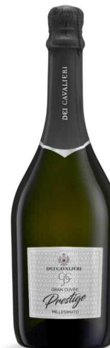
PRESTIGE EXTRA DRY