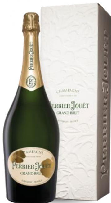
PERRIER JOUËT GRAND BRUT