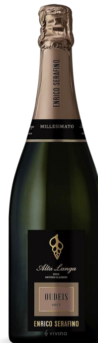
ENRICO SERAFINO OUDEIS BRUT