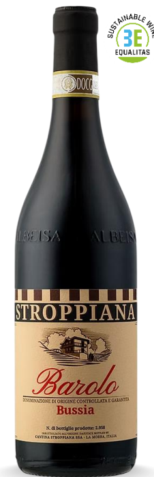
STROPPIANA BAROLO BUSSIA