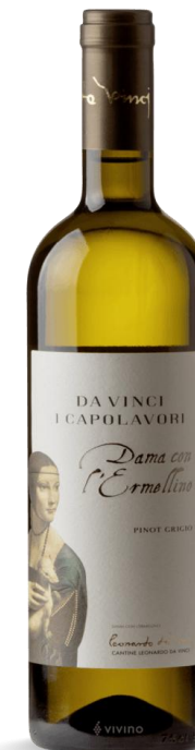
DAMA CON L'ERMELLINO