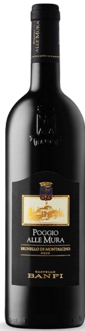
POGGIO ALLE MURA BRUNELLO