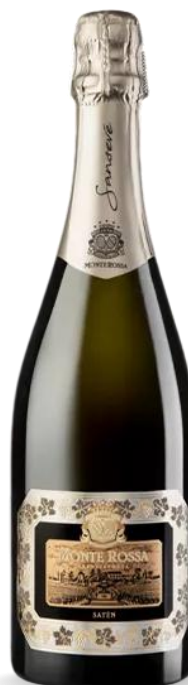
MONTEN ROSSA SANSEVE SATEN