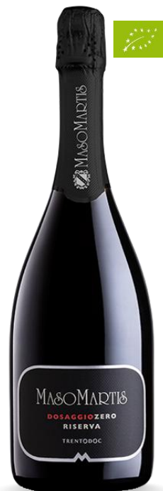
MASO MARTIS DOSAGGIO ZERO RISERVA