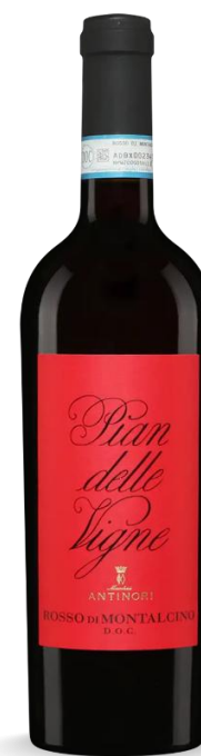
PIAN DELLE VIGNE ANTINORI