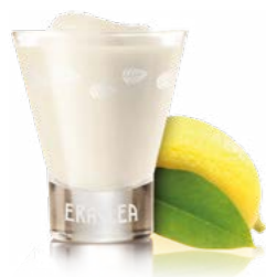
Sherbet al limone