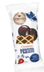
Crostatina con amarena Fabbri