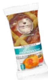
Crostatina senza zuccheri aggiunti all'albicocca