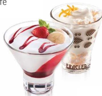
Crema allo yogurt e Crema Fiordilatte