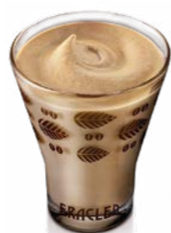
Crema al caffè