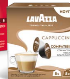
Capsule compatibili con macchine Nescafé® Dolce Gusto®*

* Lavazza non è affiliata a, né approvata o sponsorizzata da Nespresso. Nescafé® Dolce Gusto® sono marchi di terzi senza alcun collegamento con Luigi Lavazza S.p.A.