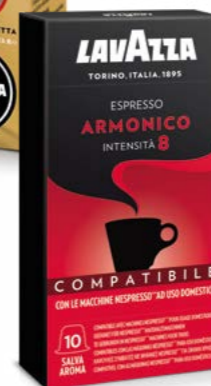
Capsule compatibili con macchine Nespresso Original*