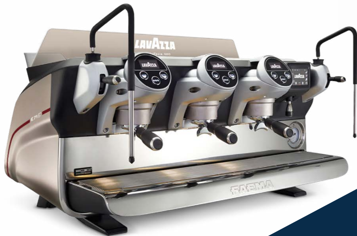
macchina FAEMA E71-E

Ogni macchina si mostra in tutto il suo stile, grazie ai dettagli ricercati, le linee e il design di livello . Un ventaglio di attrezzature ideali per chi è alla ricerca delle migliori soluzioni professionali , che sorprende in ogni occasione.