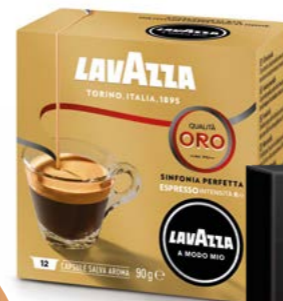
Capsule LAVAZZA A MODO MIO