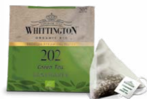
Tè filtri piramidali