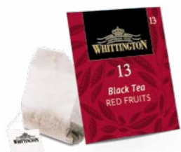
Tè filtri in carta