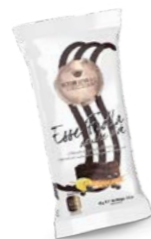
Essefrolla® double ciok