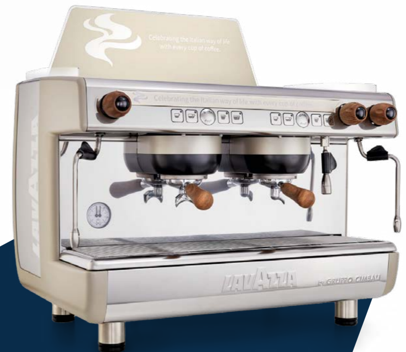
macchina CIMBALLI DEDICATA