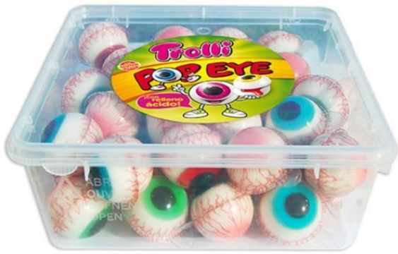
11677 - POP EYE INC. PZ.45 GR.846 TROLLI