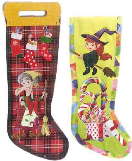
1191 – CALZA CELLOFAN+MANIGLIA CA.35 PZ.100