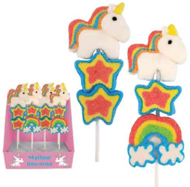
4943 – LECCA SPIEDINO MALLOW UNICORNO PZ.12