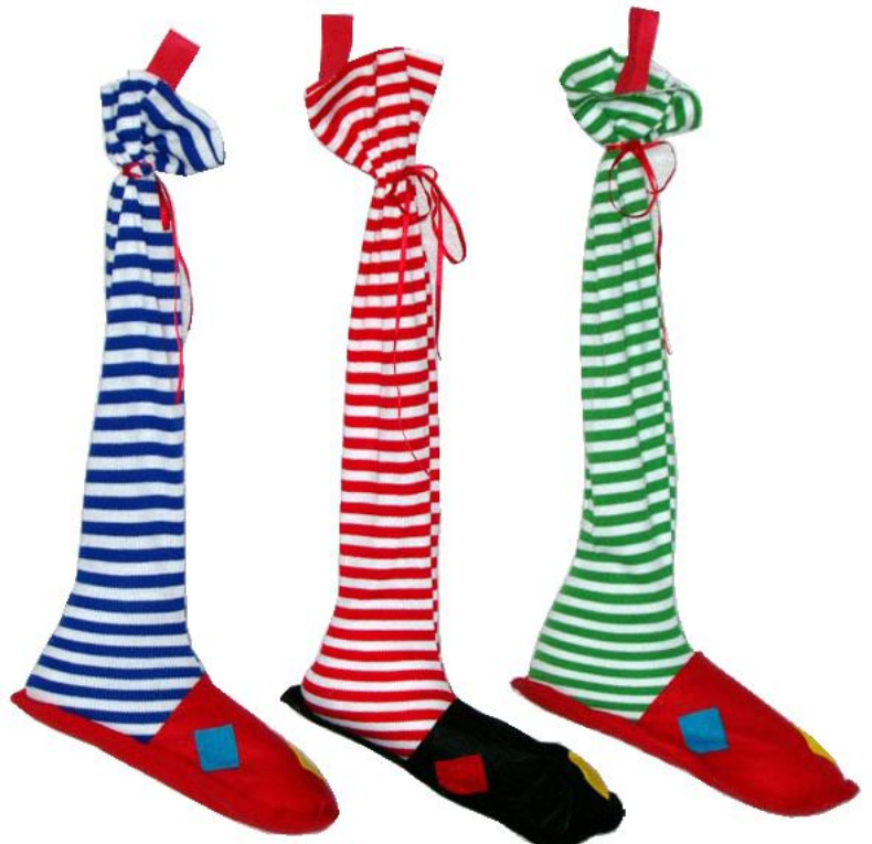
5790 – CALZA CIABATTA CM.50 PZ.3