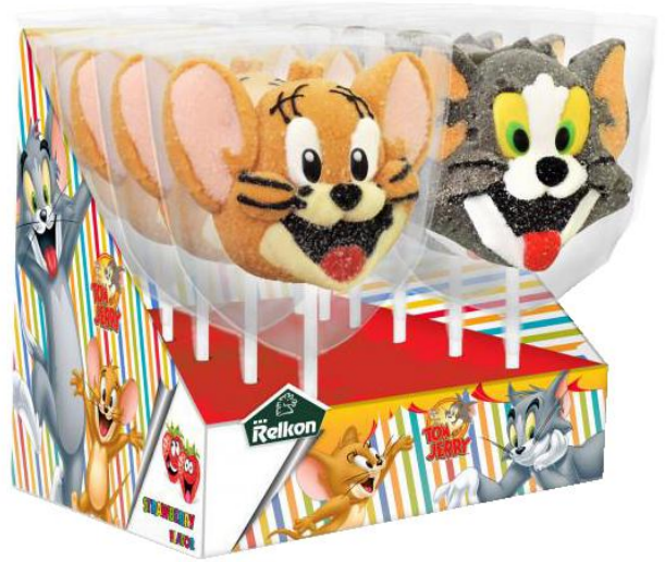
11280 – LECCA MALLOW TOM & JERRY PZ.12