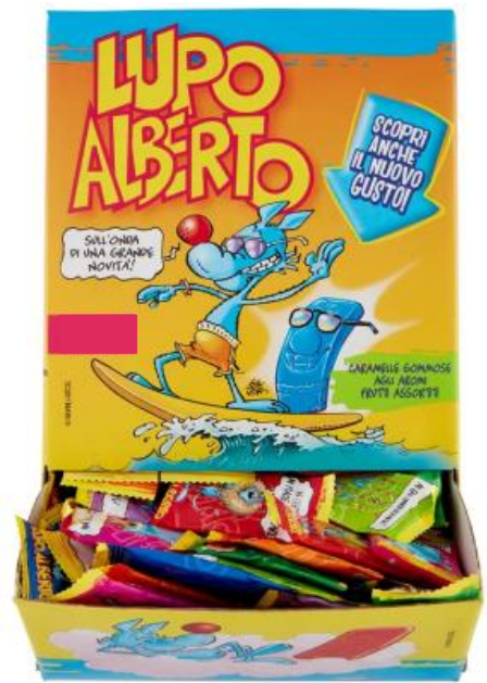
2995 – LUPO ALBERTO PZ.200