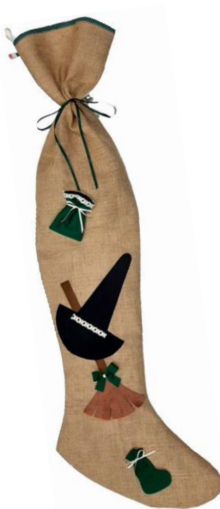
11549– CALZA GIG. SCOPA E CAPPELLO 11550CM.120 PZ.1 ART.9723