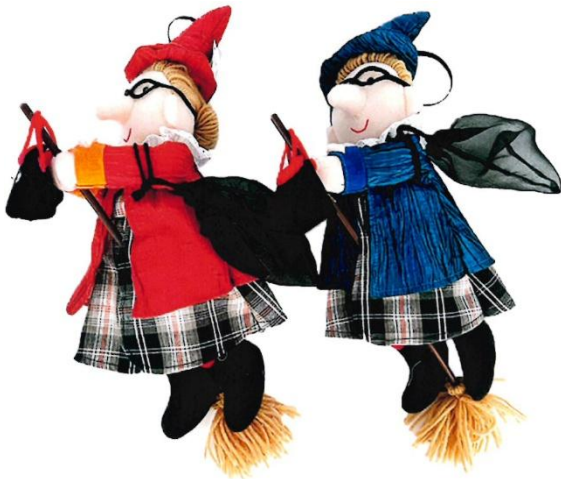
11631 – BEFANA VOLANTE PEZZA CON SACCO CM.40 ART.4408