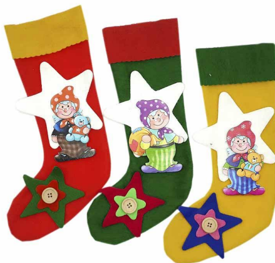
AUR35 – CALZA AURORA 35 PZ.3