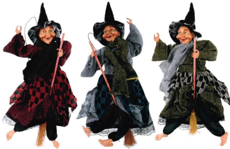
12176 – BEFANA QUADRETTI VOLANTE CM.40 A.4445