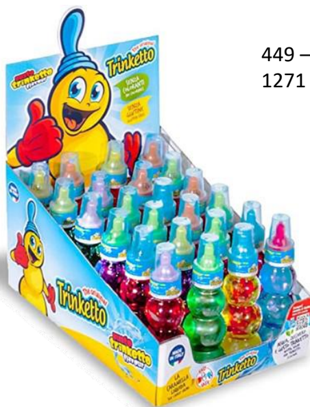
449 – TRINKETTO PZ.24