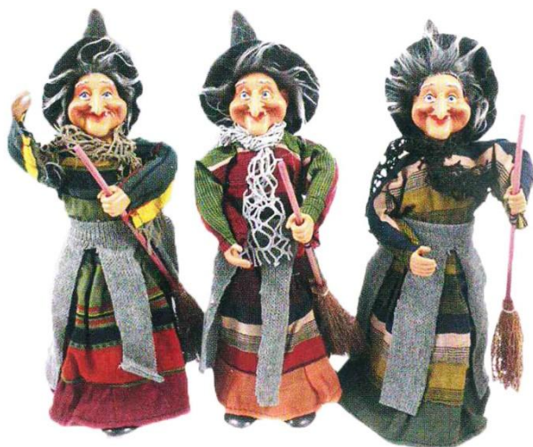
5635 – BEFANA ASIMINA CONT. CM.25 ART.4374