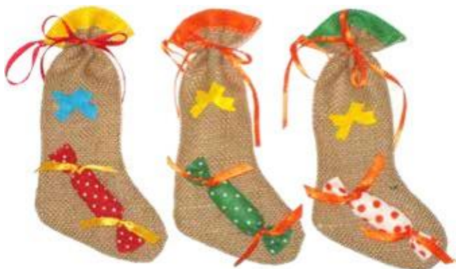
11799 – CALZINA JUTA CARAM.CM18 PZ.6 A.9480