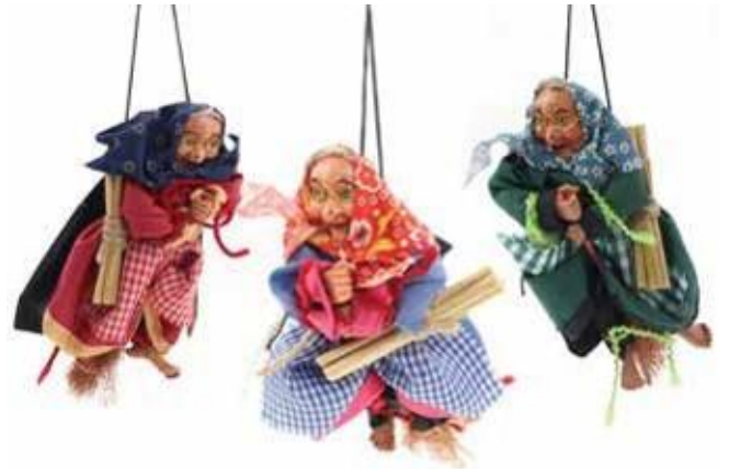
11806 – BEFANA VOLANTE BOSCAIOLA CM.15 PZ.6 A.4435