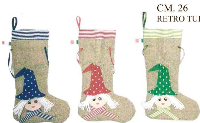
CM. 26 RETRO TULLE