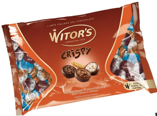
11609 – CRISPY MIX KG.1 PZ.65 CA.