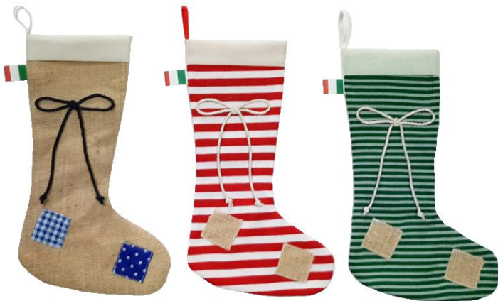
11547 – CALZA SPECIAL MIX CM.34 PZ.3