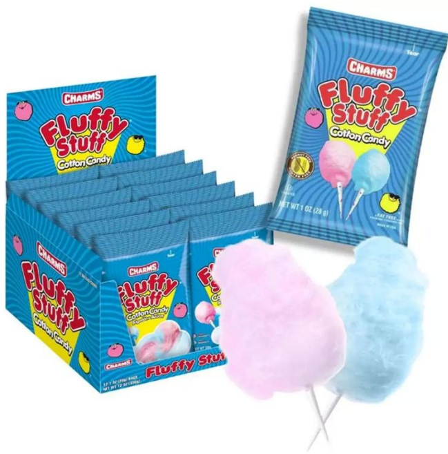
12080 - FLUFFY STUFF GR.28 PZ.12