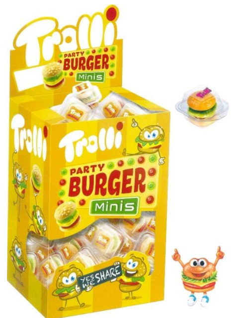
489 - MINI BURGER DISPLAY TROLLI PZ.80