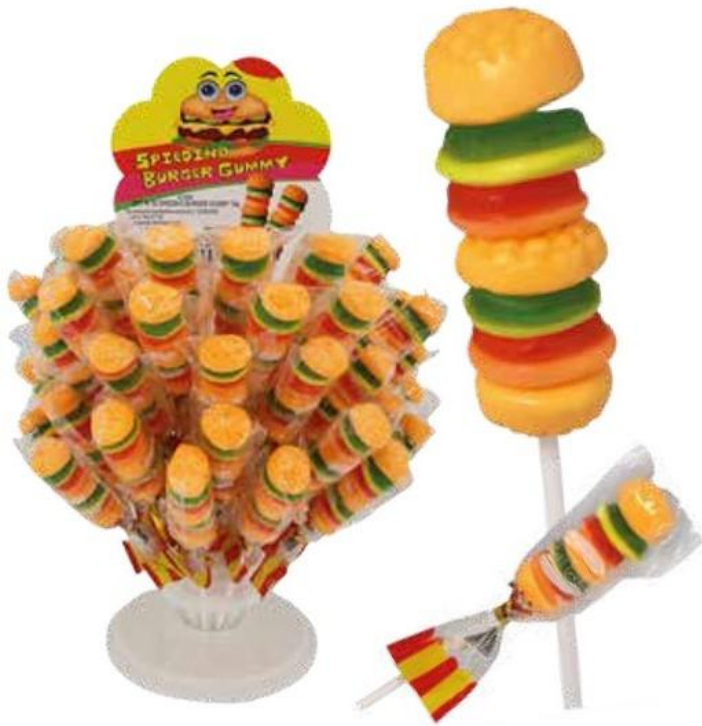
4560 – SPIEDINO BURGER GUMMY GR.19 PZ.60