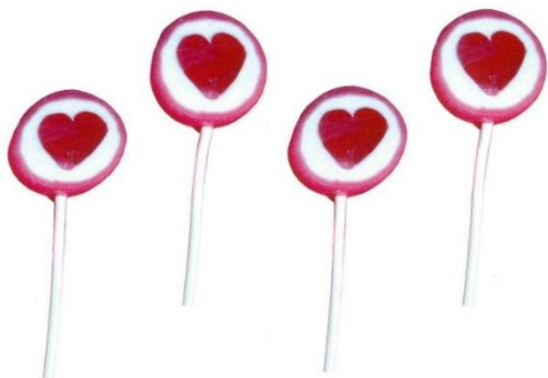
7848 – LECCA MINI ROCKS CUORE PZ.125