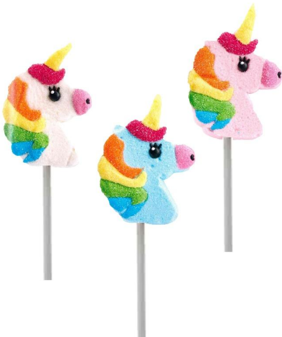
9208 – LECCA MALLOW UNICORNO PZ.12