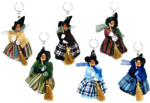
1896 – BEFANA PORTACHIAVI CM.11 PZ.6 ART.4442