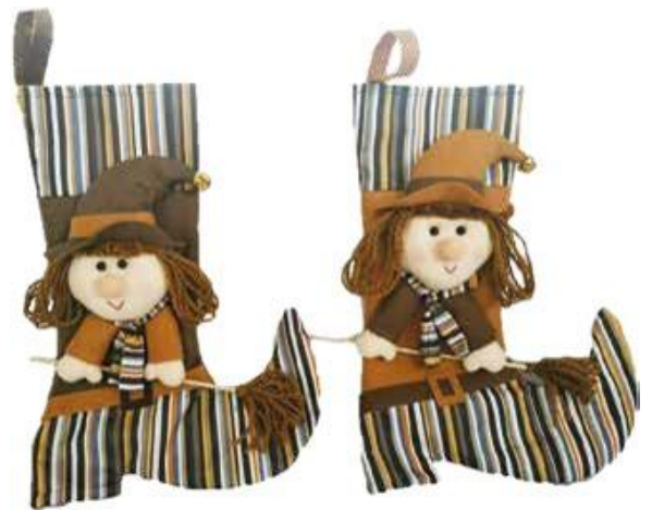
7405 – CALZA BEFANA C/CAMPAN CM40 PZ.2 A.3104