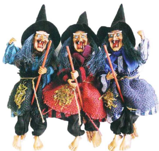
1610 – BEFANA VOL. SON.OCCHI LUM. CM30 A.4356