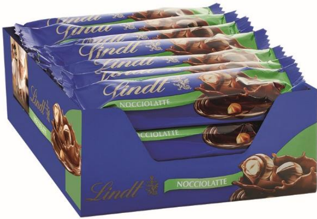
2526 – BARRETTE NOCCIOLATTE PZ.36