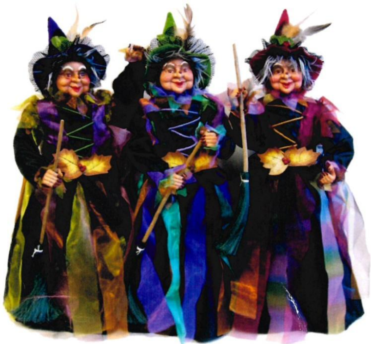
10657 – BEFANA ARCOBALENO CM.60 ART.4232