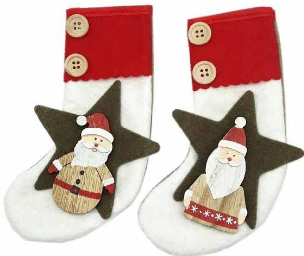
VAL18 – CALZA VALERIA 18 PZ.4