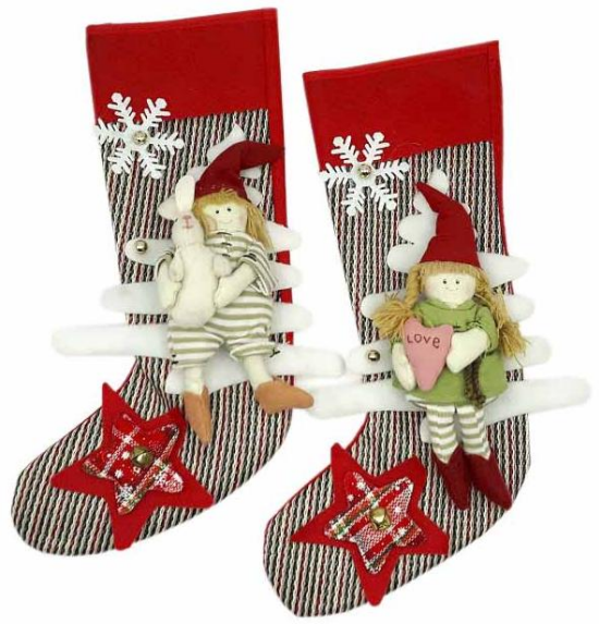
MAR35 – CALZA MARTA 35 PZ. 1