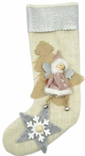
BEA35 – CALZA BEATRICE 35 PZ.1