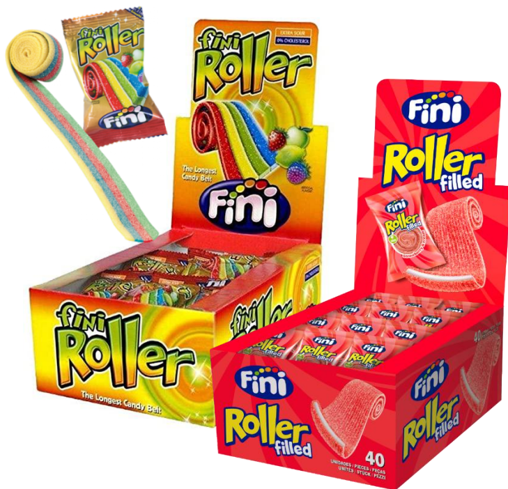
5201 – ROLLER MIX GR.25 PZ.40