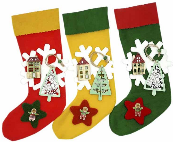
ARI35 – CALZA ARIANNA 35 PZ.3