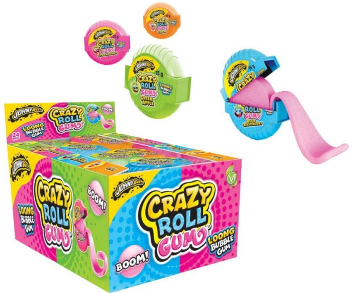
12062 - CRAZY ROLL BUBBLE GUM GR.15 PZ.24