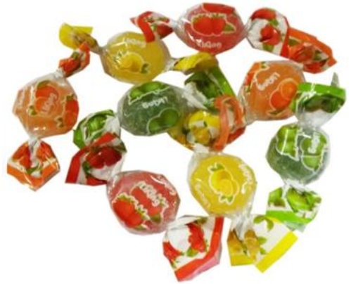
8262 – GELATINE FRUTTA KG.1 PZ.136