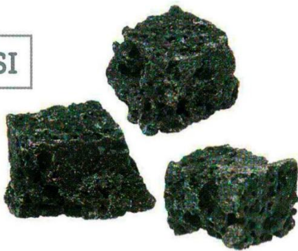
1231 - CARBONE NERO DI ZUCCHERO KG.3