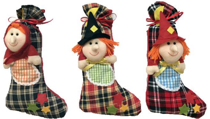
11635 – CALZA SCOZZESE PZ.3 CM.37