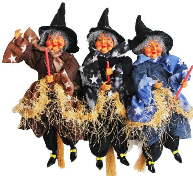
11628- BEFANA VOLANTE SONORA CM.25