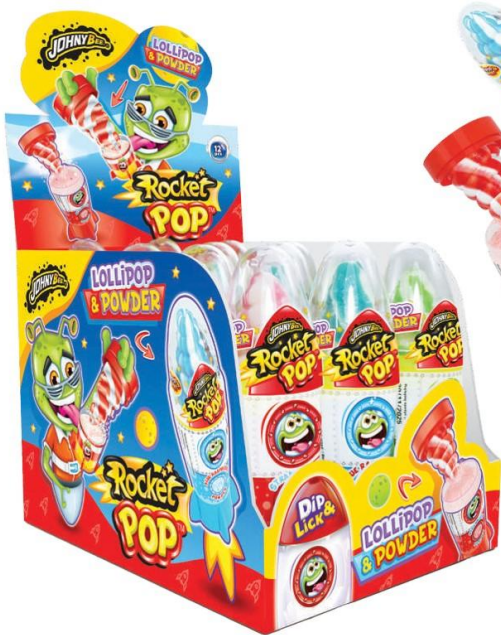
12061 - ROCKET POP DISPLAY GR.50 PZ.12