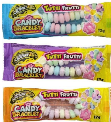
1200 - BRACCIALETTO CARAMELLA GR.12 PZ.50