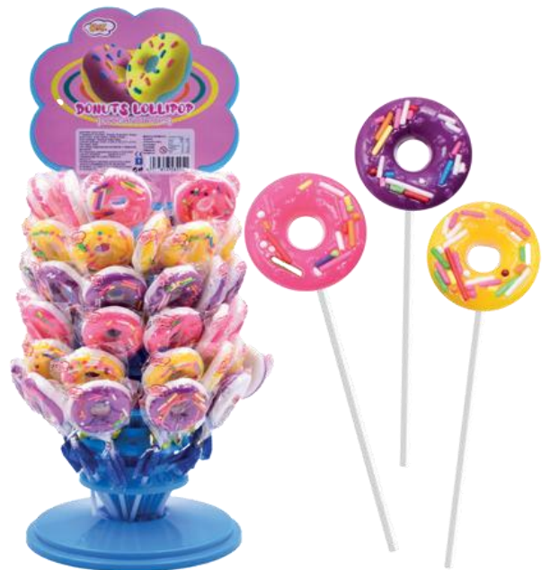
4639 - DONUTS LOLLIPOP GR.15 PZ.60