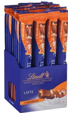
9145 – BARRETTE SNACK CARAMELLO PZ.24