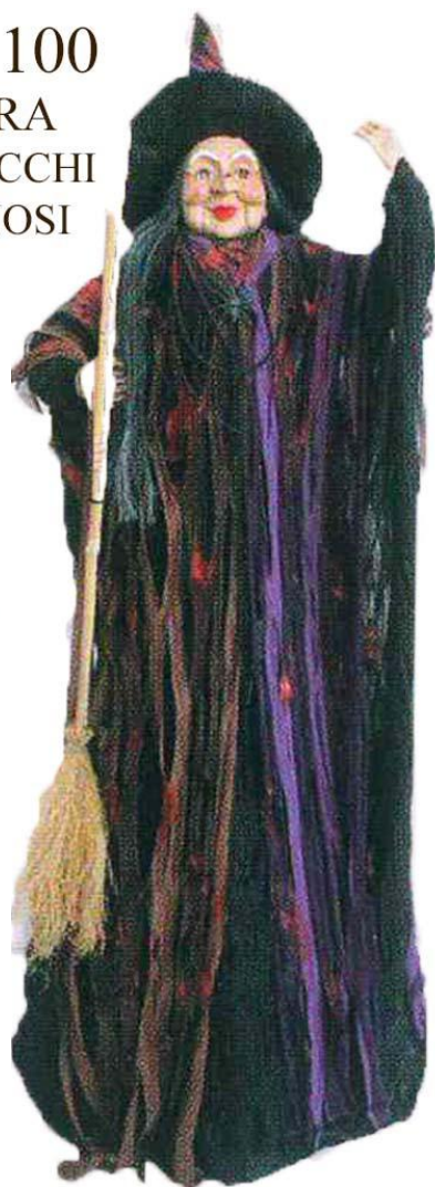
10659 – BEFANA IN PIEDI SONORA CM100 A.4295