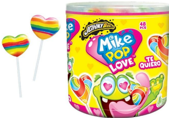
12059 - MIKE LOVE GR.15 PZ.48