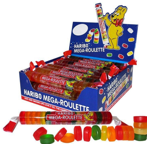
471 - MEGA ROULETTE PZ.40 HARIBO