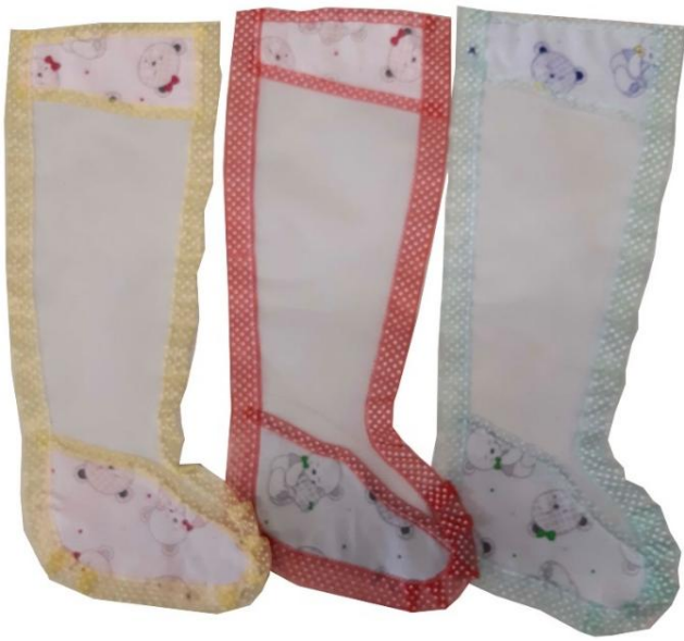
10629 – CALZA ART.886 TULLE CM.36 PZ6