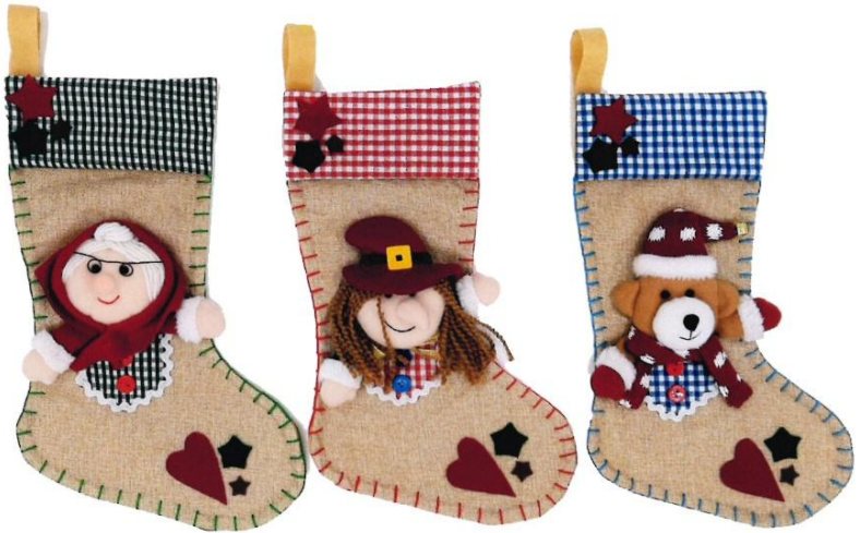
12172 – CALZA PUPAZZO PZ.3 CM.35 ART.3134