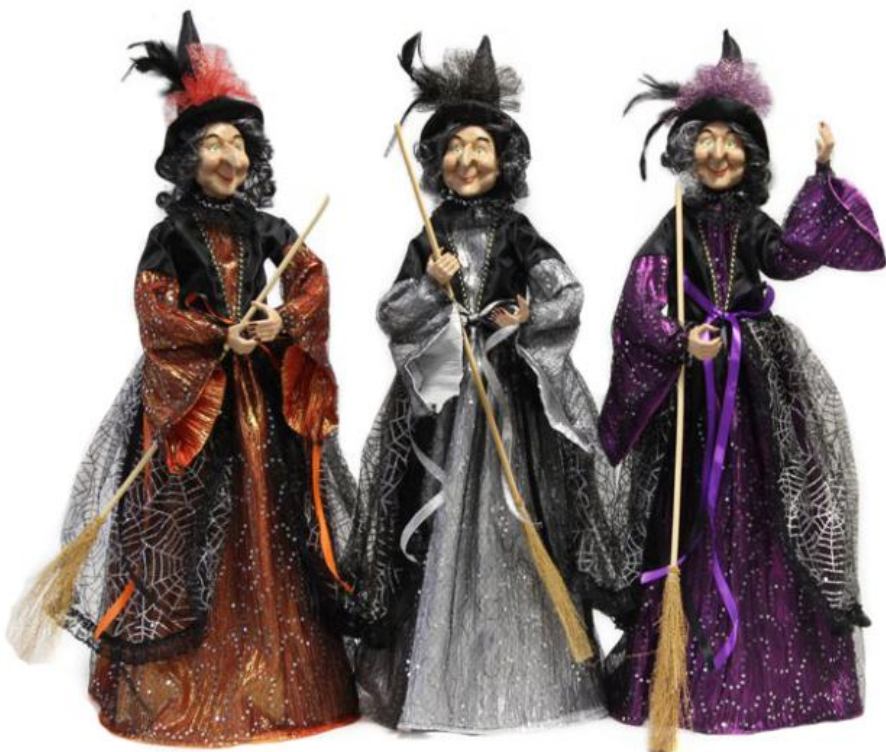
11630 – BEFANA IN PIEDI LINETTA CM.70 A.4345