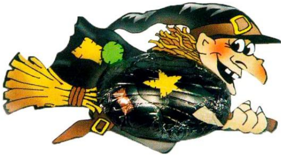
6897 - BEFANA C/SCOPA DISPLAY PZ.40 GR.12.5