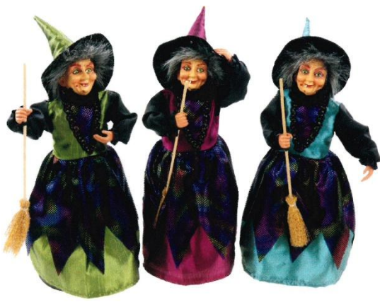
12174 – BEFANA LELLA CON SACCO CM.30 ART.4440