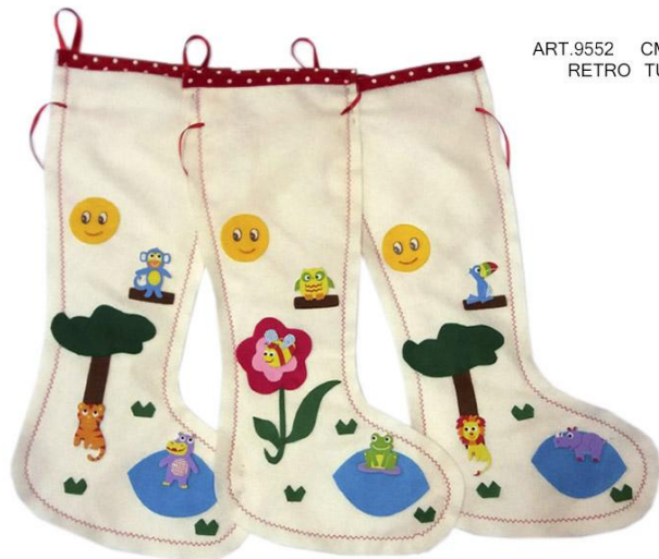
ART.9552 CM.40 RETRO TULLE