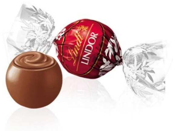
6924 – BOULES LINDOR LATTE KG.1