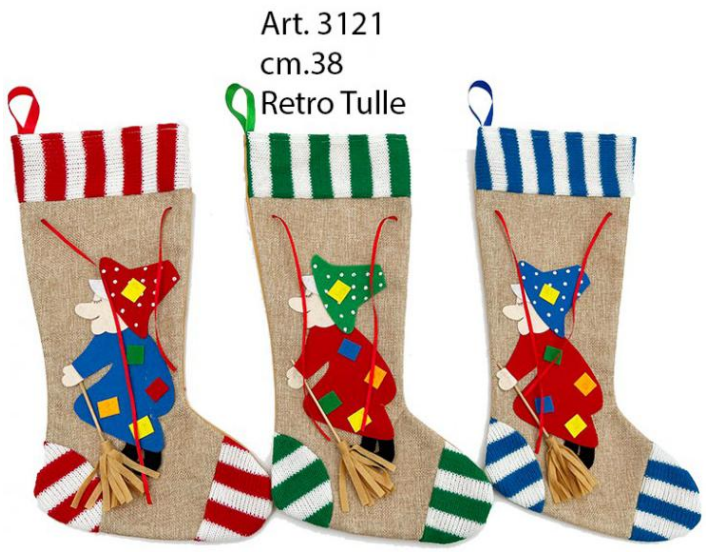
Art. 3121 cm.38 Retro Tulle