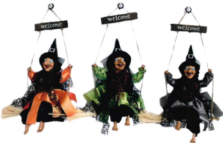
8152 – BEFANA ALTALENA C/MOVIMENTO CM.40 ART.4297