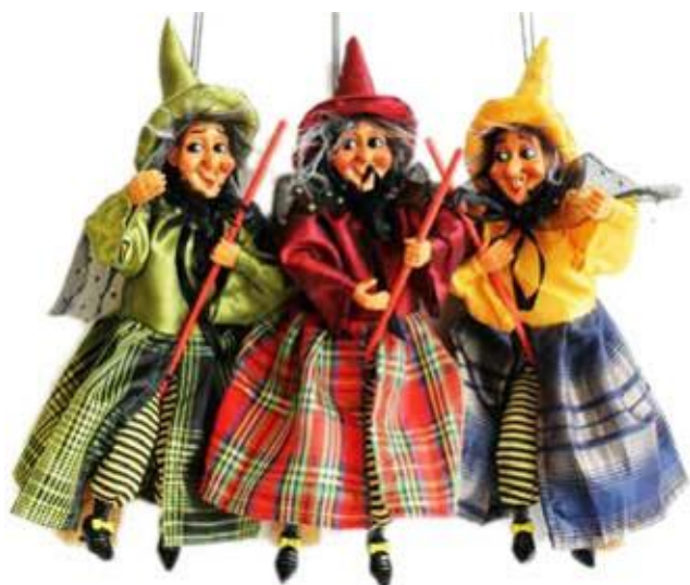
1392 – BEFANA VOLANTE GISELLA CM28 A.4275