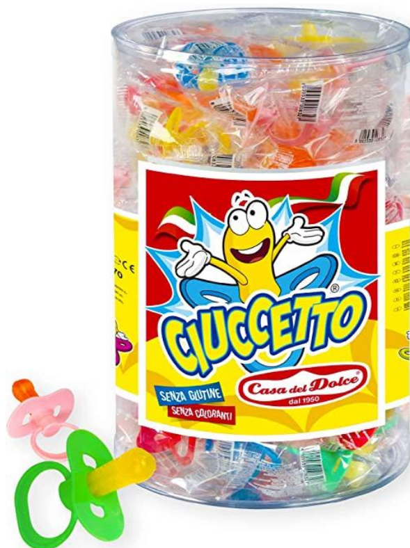
6059 - CIUCCI DOLCI PZ.70