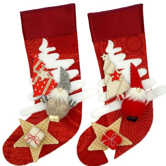
EMI35 – CALZA EMILY 35 PZ.1