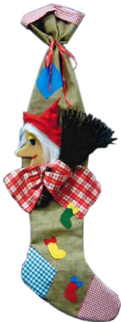
6128 – CALZA GIG. JUTA CESIRA CM120 PZ.1 ART.9016