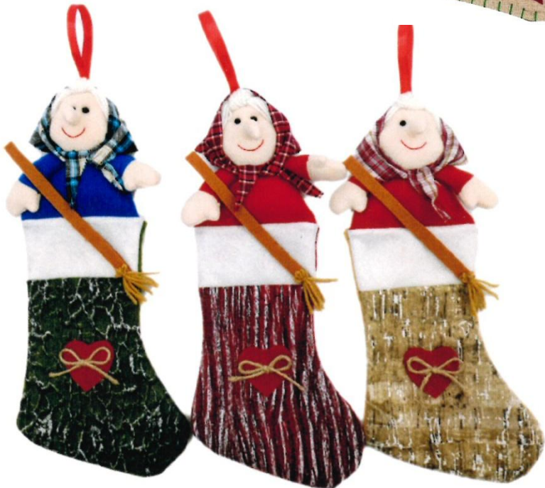
12173 – CALZA BEFANA PEZZOLA PZ.3 CM.38 ART.3116