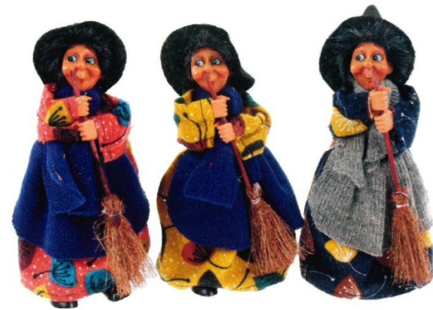
11803 – BEFANA FANNY CONTENITORE CM.17 ART.4425