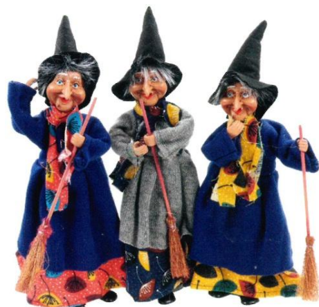
1707 – BEFANA ENERGY CONTENITORE CM.30 ART.4426