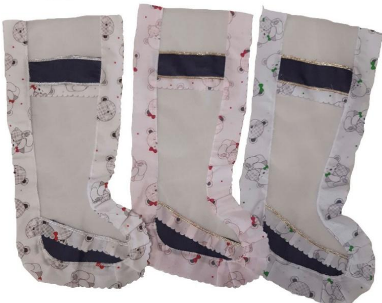
10631 – CALZA ART.889 TULLE CM 36 PZ.6