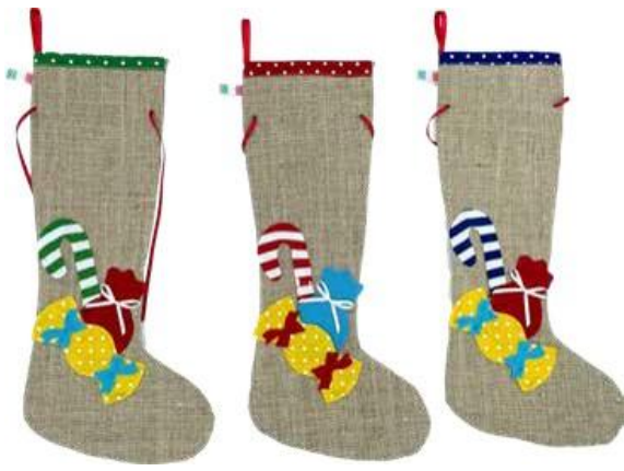
11800 – CALZA JUTA DONI CM40 PZ.3 A.9762