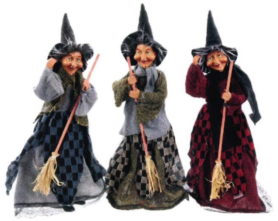
12178 – BEFANA QUADRETTI CONTENITORE CM.40 A.4427