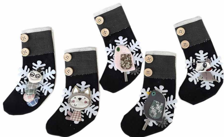
VIT18 – CALZA VITTORIA 18 PZ.5