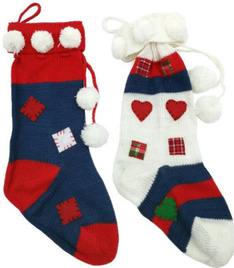
11632 – CALZA LANA CLASSIC CM.36 PZ.2