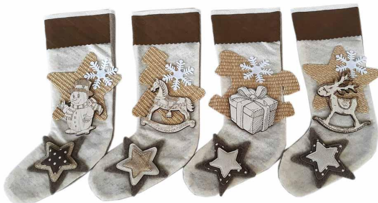
CON35 – CALZA CONCETTA 35 PZ.4