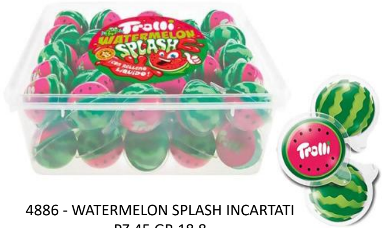
4886 - WATERMELON SPLASH INCARTATI PZ.45 GR.18,8