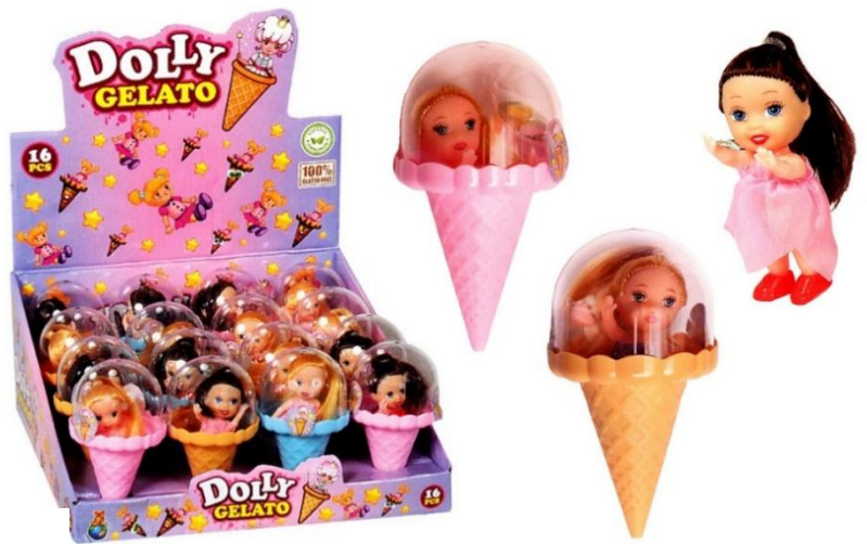
4530 – DOLLY GELATO PZ.16 ROSSINI