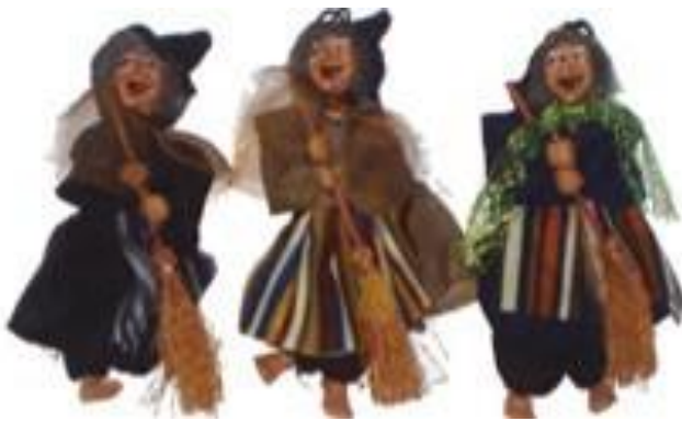
11805– BEFANA VOLANTE MINI CM.12 PZ.6 A.4152