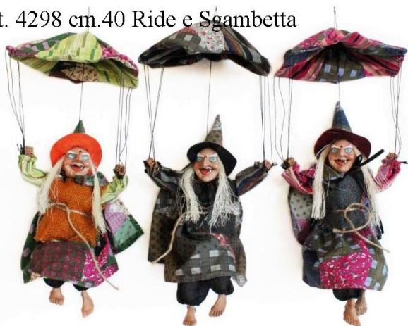
5488 – BEFANA PARACADUTE C/MOVIMENTO CM.40 ART.4298