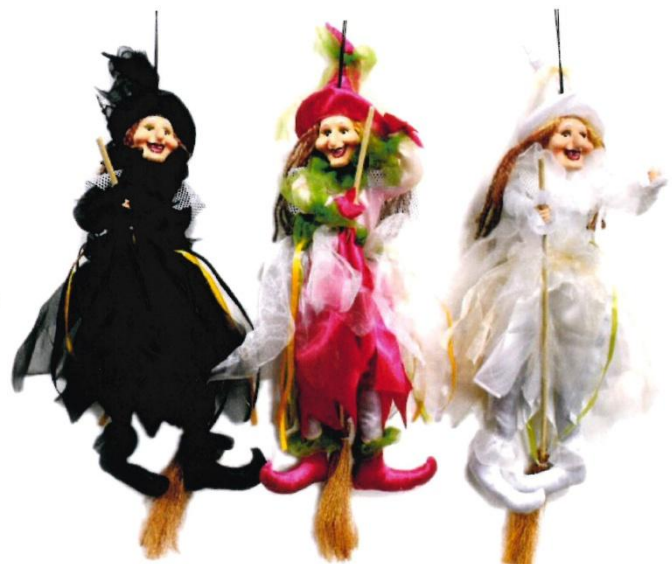
12177 – BEFANA ELEGANTE CM.45 ART.4319