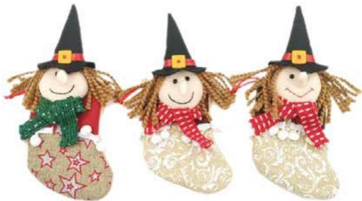
7184 – CALZA JUTA C/BEFANA CM.26 PZ.3 A.3112