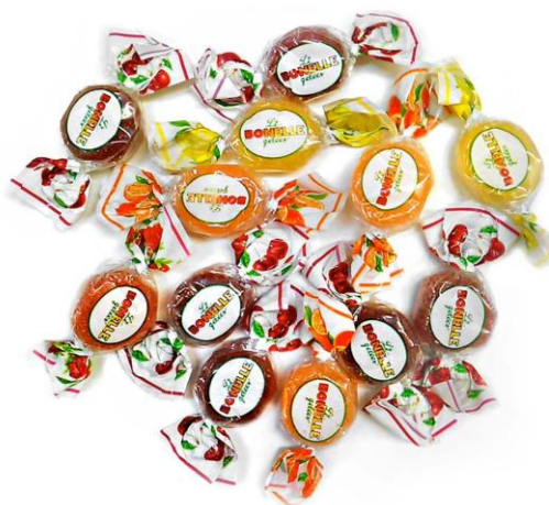
5564 - CAR.LE BONELLE ROTONDA KG.1 CA PZ.125