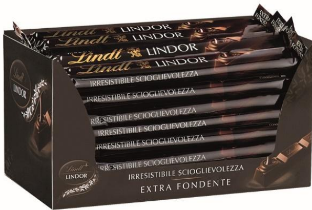
2232 – BARRETTE SNACK LINDOR FONDENTISSIMO PZ.24