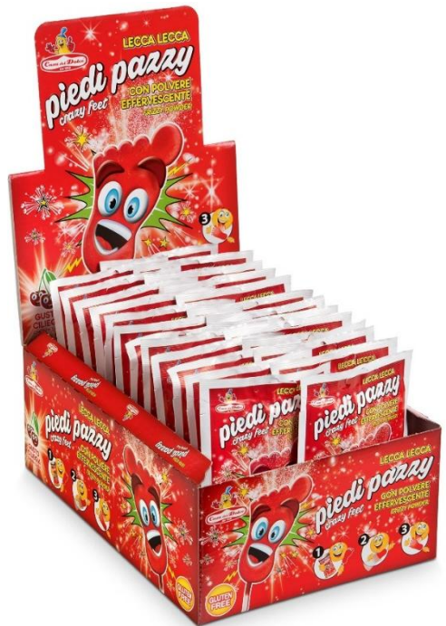
10829 - LECCA PIEDI PAZZY GR.20 PZ.40