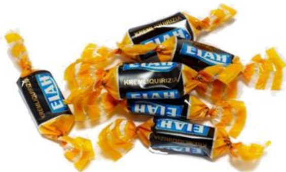
252 – KREMLIQUIRIZIA KG.1