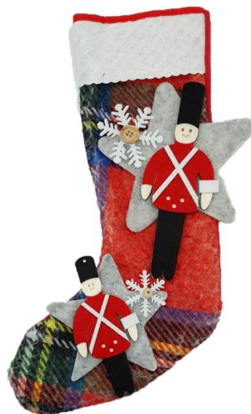
JOL35 – CALZA JOLE 35 PZ.2