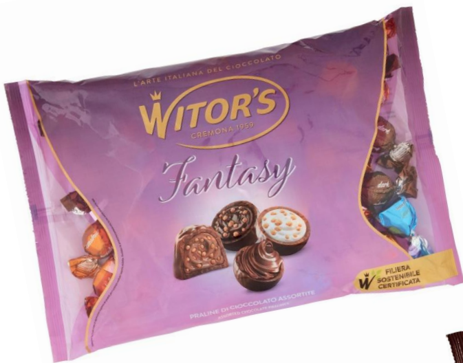
4014 – MAXIKILO FANTASY ASSORTITI KG.1 PZ.65 CA.