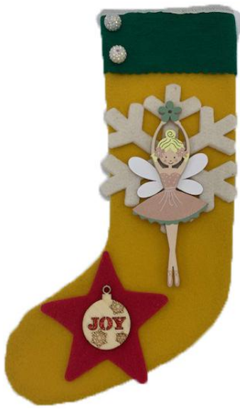
CAN35 – CALZA CANDIDA 35 PZ.1