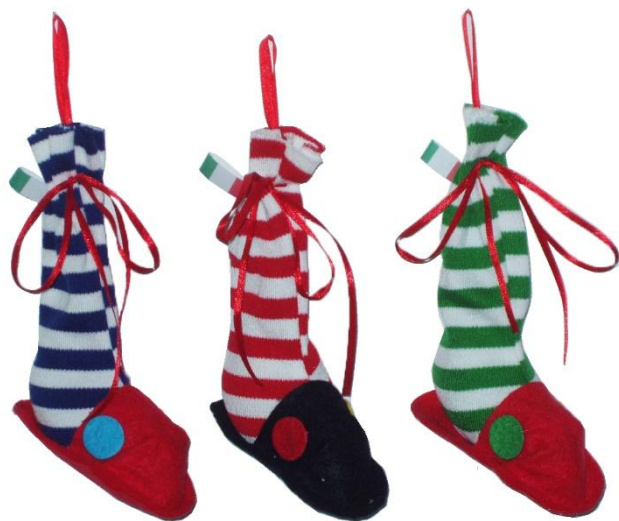
1168 – CALZINA CIABATTA CM.20 PZ.6