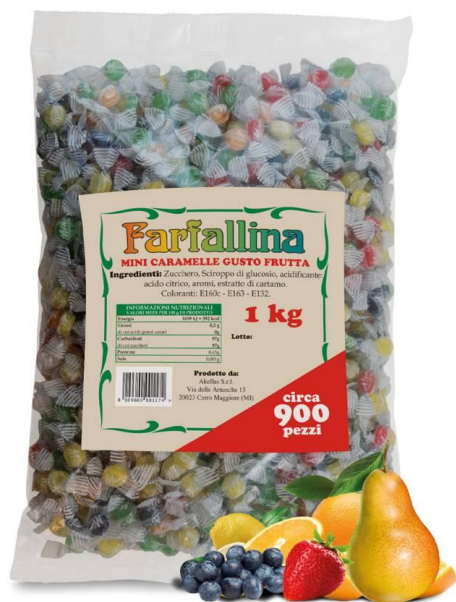
12181 - CAR. FARFALLINA KG.1 PZ.970