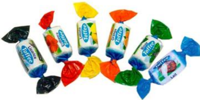
8305 – TOFFEE ASSORTITE KG.1 PZ.143