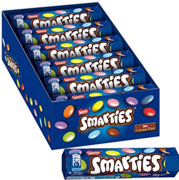
476 – SMARTIES PZ.24