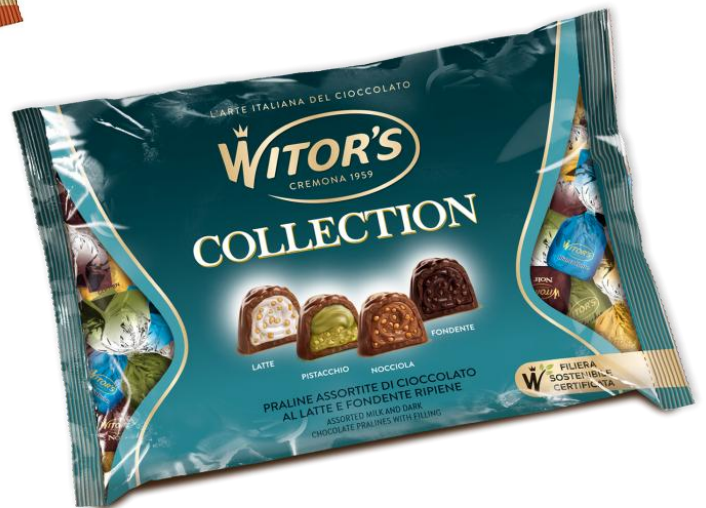
11798 – MAZIKILO COLLECTION KG.1 PZ.65 CA.