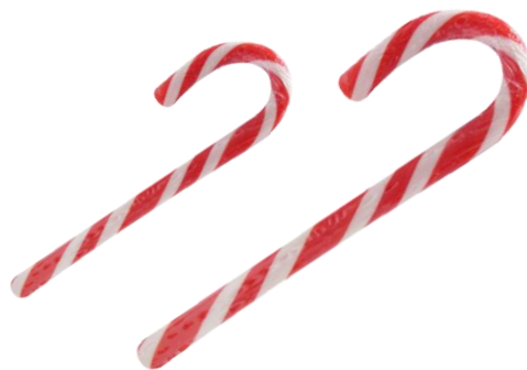
5793 – MANICO OMBRELLO B/ROSSO 397 – MANICO OMBRELLO B/ROSSO