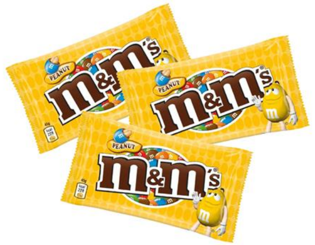
65 – M&M's ARACHIDI PZ.24