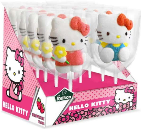
4457 - LECCA MALLOW HELLO KITTY PZ.12