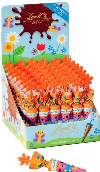
1114 – OMBRELLINI LATTE PZ.42