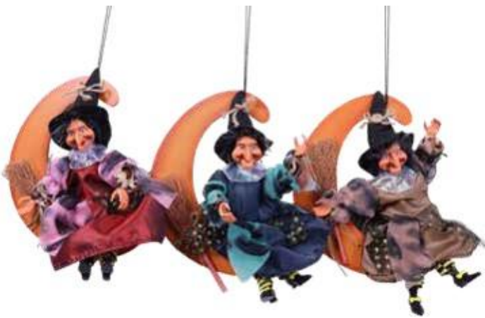
11808 – BEFANA SU LUNA CM.20 A.4423