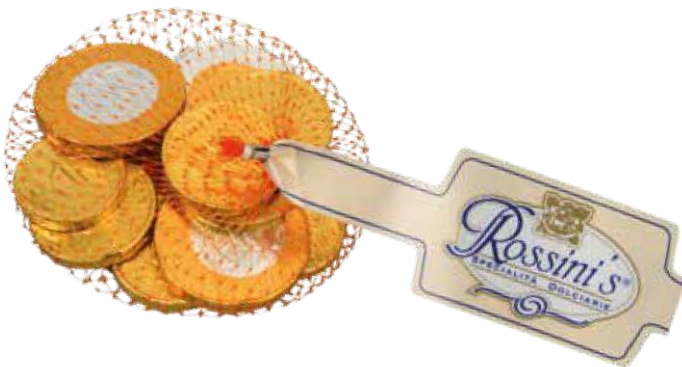
10639 – MONETE RETE EURO GR.50