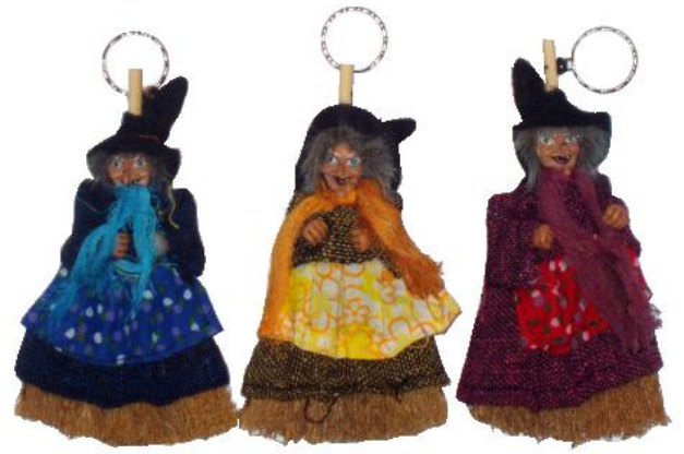
11636 – SCOPINA C/BEFANA CM.11 PZ.6