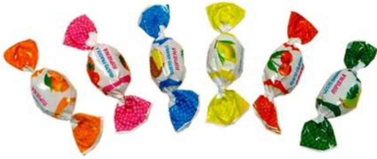
8886 – FRUTTA OVALE KG.1 PZ.180