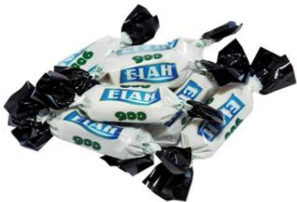
253 – NOVECENTO KG.1