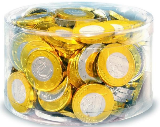
10637 – MONETE EURO CIL. KG.1 PZ.185