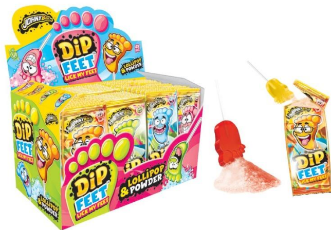
12054 - DIP FEET POP CANDY GR.9 PZ.48