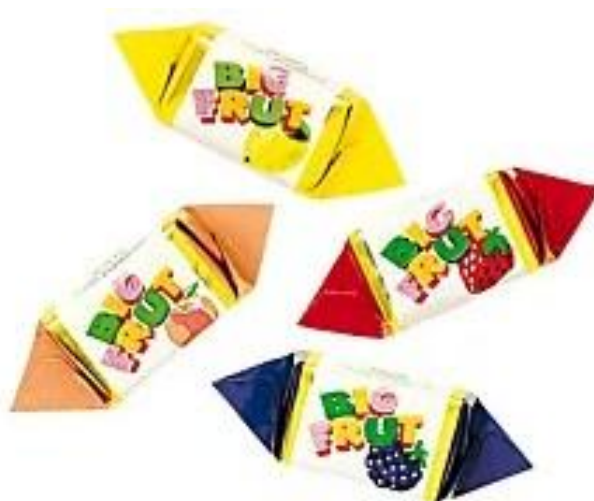
256 – CAR. BIG FRUT KG.1