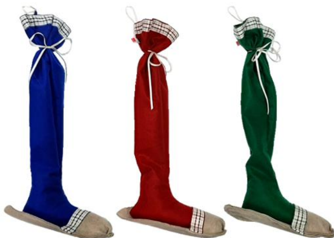
11550 – CALZA CIABATTA PANNOLENCI CM.20 PZ.6