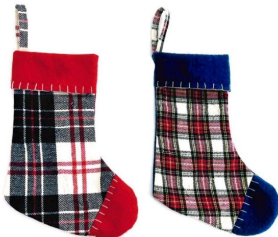
5630 – CALZA SCOZZESE PANNO PZ.6 CM.25 ART.3137