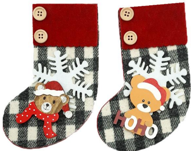
ANNAF18 – CALZA ANNA FELTRO 18 PZ.4