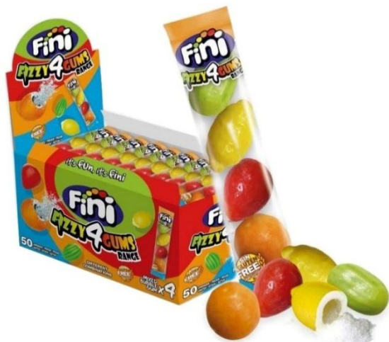
4937 - CHICLE MACEDONIA GR.20 PZ.50 FINI