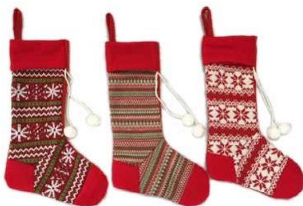
7618 – CALZA MAGLIA PON-PON CM.40 PZ.3 A.3083