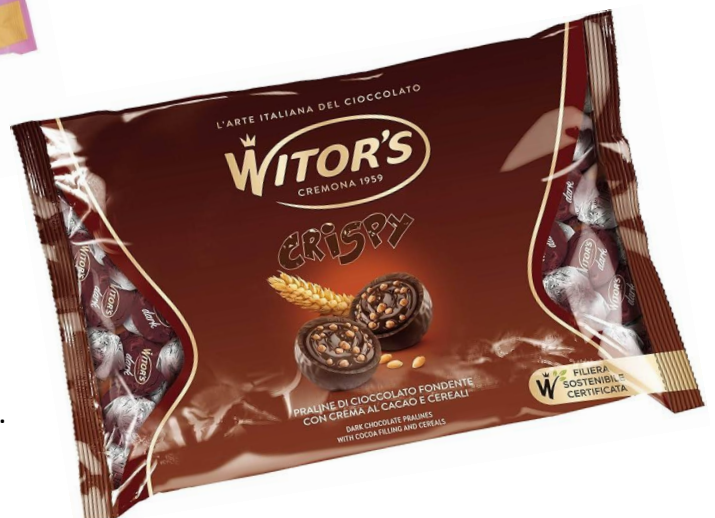
12264 – CRISPY MAXI FONDENTE KG.1 PZ.65 CA.