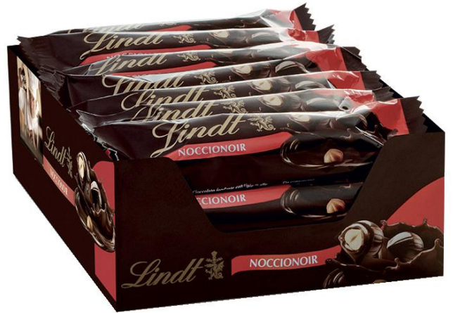
263 – BARRETTE NOCCIONOIR PZ.18