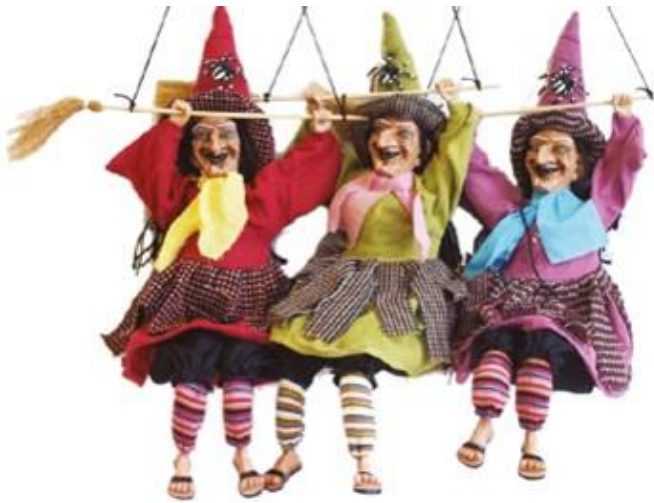
Art. 4348 cm.20 Contenitore