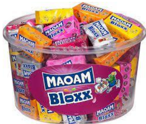
6840 - MAOAM CAR.MORBIDE FRUTTA CIL. PZ.50