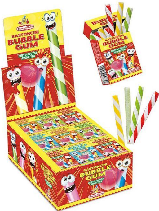
81 – SIGARETTE BUBBLEGUM PZ.36