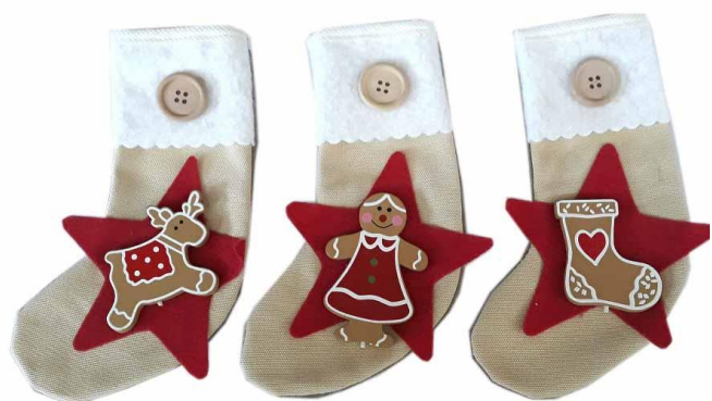
IMM18 – CALZA IMMA 18 PZ.2