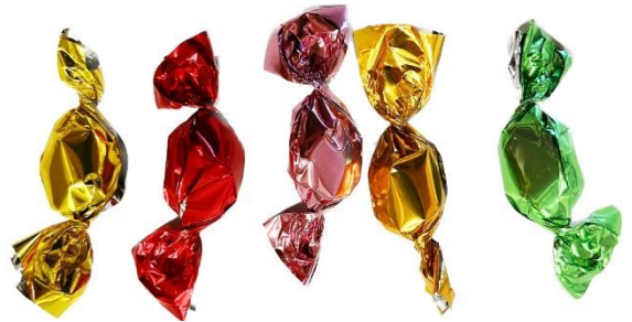
11782 – CAMELLA FRUTTA SELECTION KG.1 PZ.380 CA.