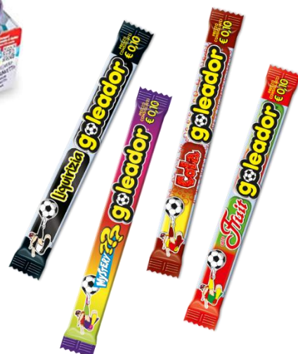
4629 – GOLEADOR COLA PZ.200