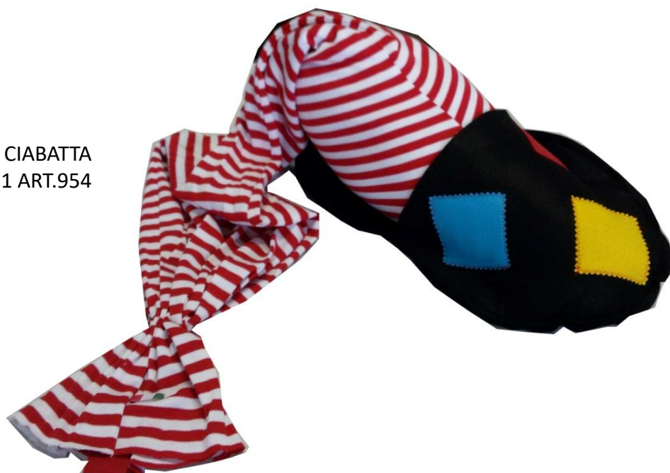
1824 – CALZA GIG. CIABATTA CM120 PZ.1 ART.954